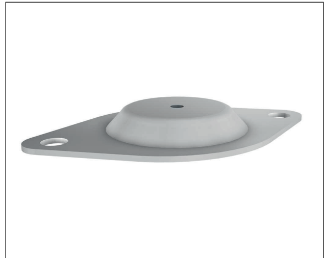
ISOTO P® FP, galvanised

Используйте наши знания в вопросах защиты от вибрации. Мы с радостью проконсультируем Вас и разработаем индивидуальное решение для виброизоляции.